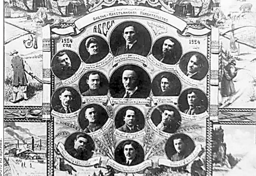
Правительство БАССР. 1924 год.

Конституцию БАССР передали на утверждение Всероссийскому Центральному Исполнительному Комитету, где для рассмотрения конституций автономных республик была создана специальная комиссия.