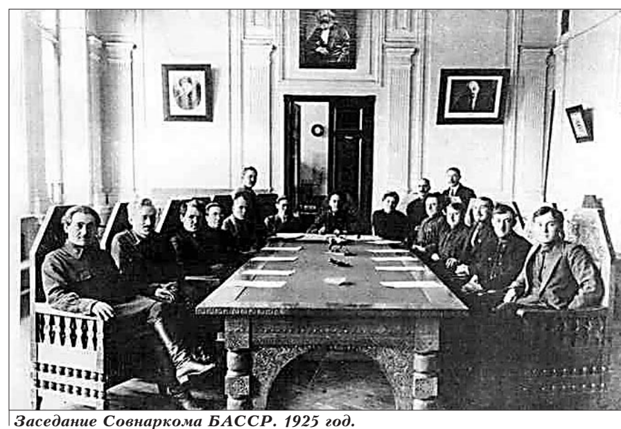
Заседание Совнаркома БАССР. 1925 год.

Конституция БАССР 1925 года устанавливала, что республика имеет свой Государственный герб и Государственный флаг. Местом пребывания правительства Башкортостана был определен город Уфа.