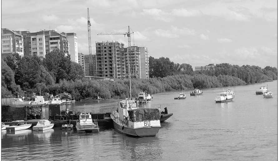
Сибирский вариант Сипайлова на Оби.

Альфред СТАСЮКОНИС. Уфа — Новосибирск — Уфа.