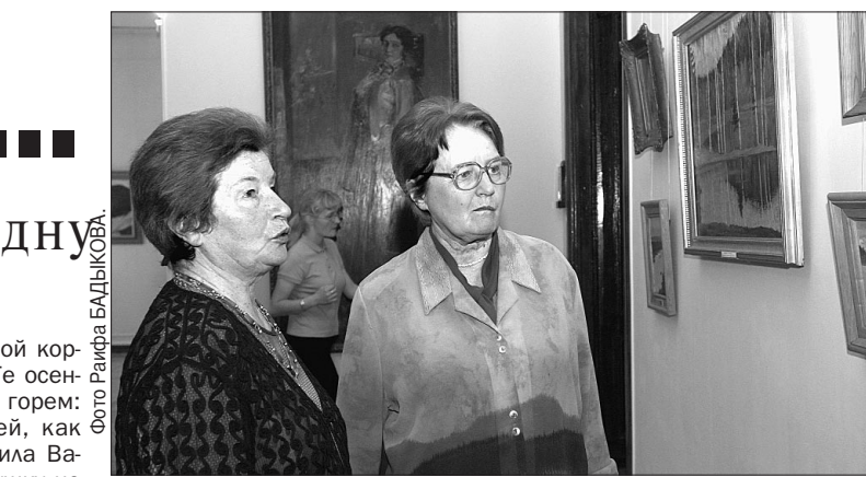
Чувствуют ли эти картины, кто стоит перед ними?