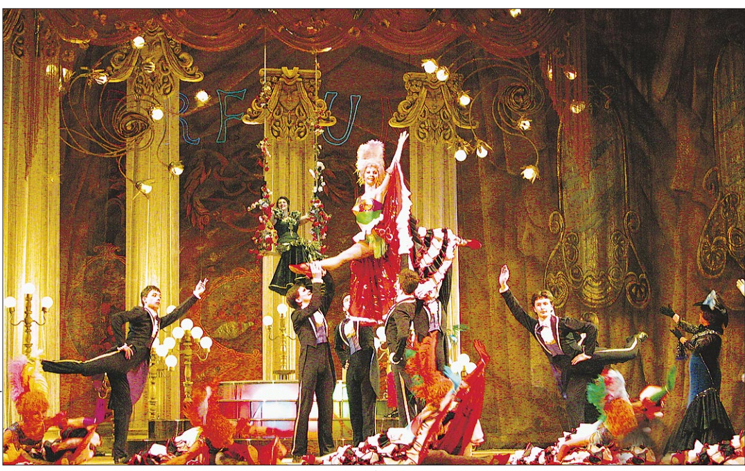
Привычным к серьезной музыке артистам непросто было «расквашаться» в оперетте...

Башкирский государственный театр оперы и балета можно поздравить: выдержал экзамен на постановку легкого музыкального жанра.