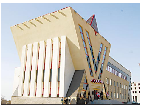
Это здание синагоги украсило столицу.