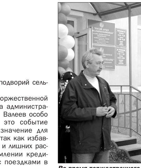
Во время торжественного открытия.

Только он производил различные марки проволоки, необходимые и для винтовок, и для грозных «катюш». Как и миллионы тружеников тыла, белебеевские металлурги работали без выходных по 12 — 14 часов в день, норму выработки перевыполняли до 170 процентов. Более шести с половиной тысяч тружеников Белебеевского металлургического комбината сражались с оружием в руках на передовой. Более двух тысяч металлургов погибли в боях.