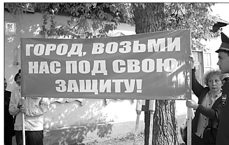
Поможет ли город?

— А что же делать людям? Они не остаются и без квартиры, и без денег?