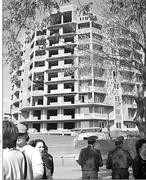
Когда эти люди вселятся в свои квартиры?

— Оформлять имуществовое право на квартиру через суд. Чтобы не остаться без жилья, если город передаст объект другому застройщику.