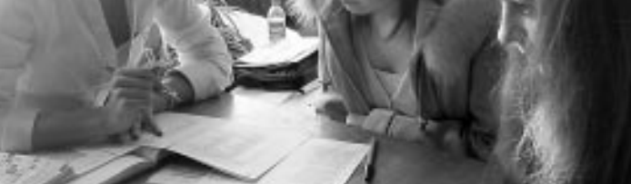
Выбрать работу — непростое занятие.

В уфимский Дворец культуры и техники ОАО «УЗММК» со всех сторон стекалась молодежь. Засыну звучала музыка, словно предвещающая начало перемен. Впрочем, именно за переменами и пришли сюда десятки подростков и молодых людей — найти себя, свое место в жизни.