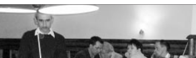
Сложная позиция: надо подумать.