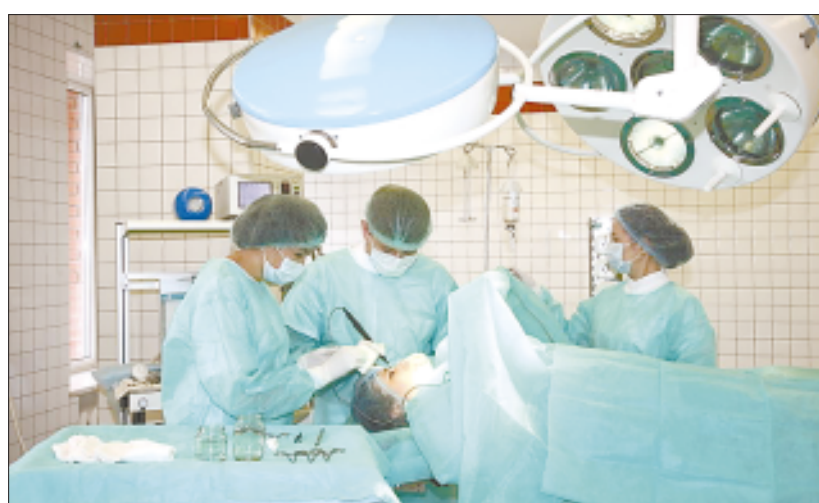
Идет пластическая операция.