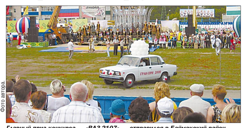
Главный приз конкурса — «ВАЗ-2107» — отправился в Баймакский район.

В рамках Дня города в Октябрьском прошел традиционный, восьмой по счету, праздник курая. Мастера игры на народном башкирском инструменте состязались в профессиональном конкурсе «Байга», а потом на октябрьской земле развернулось праздничное действо — с играми, конкурсами, викторинами и спортивными состязаниями.