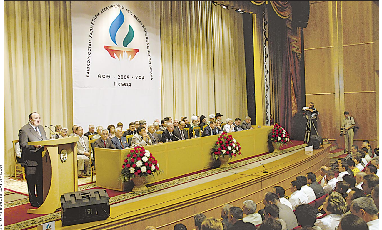
Пленарное заседание съезда прошло в особо торжественной обстановке.