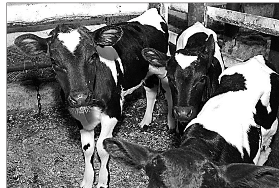
Телята черно-пестрой породы.