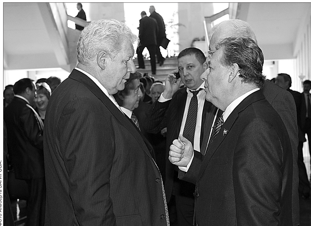
В перерыве обсуждение продолжалось.