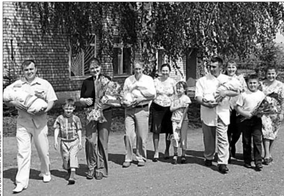
У бакалинцев — всплеск рождаемости.

В прошлом году в отделе ЗАГС... 237 браков — на десять больше, чем в 2009 году.