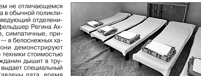
В одной из палат.

— Я требую, чтобы персонал обращался с посетителями культурно, вежливо, называя на вы, — поясняет Абдразак Абдельвахитович. — Если обратиться к данным по нашим посетителям, то становится ясно: в центр попадают большей частью нормальные люди, которые случайно перебрали и упали (или готовы были упасть) на улице. Чьими они не замерзли, не получили обморожений, не стали объектом преступления, их и привозят к нам. Утром они встают, подписывают бумаги и уходят. И, как правило, второй раз к нам не попадают, видимо, делая для себя выводы. Если же гражданин «отмечается» в центре два и более раз, сведения о нем для принятия мер передаются в районные административные комиссии или наркологический кабинет. На работу, как в старые добрые времена, никто о пребывании гражданина в центре не сообщает.